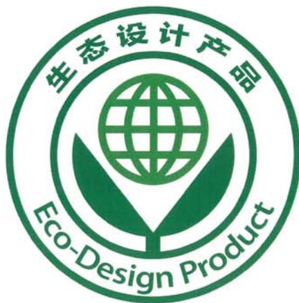
图 1 生态设计产品标识